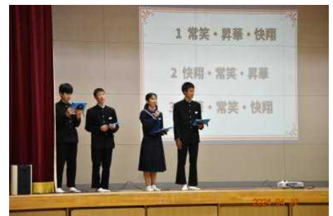
【動画等を使って説明する執行部】

このように、生徒会執行部及び専門委員長がリーダーシップを発揮し、学校生活の課題を一つひとつ解決していくことは、本校のよき伝統です。これからも、本校のリーダーとして遺憾なくその力を発揮して、よりよい学校づくりに尽力してほしいと思います。