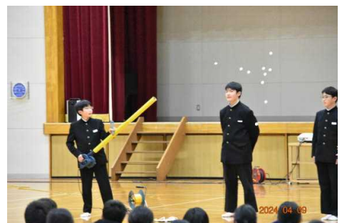
【科学部による楽しい実験教室】

特に、部活動紹介では、各部が豊かなアイデアをもとに特色ある紹介を展開していました。その姿からは、「自分たちの活動を、正しく知ってほしい」という願いや、日々の活動に取り組む上での真剣さ、部員としての誇り等に加え、「1年生の緊張した気持ちをほぐして、楽しませたい」という先輩としての温かい気持ち等、さまざまなものを感じることができました。新1年生が部活動を選択する上で、大いに役立ったのではないかと思います。先輩としての頼もしさや、最上級生としての成長が感じられる時間でした。