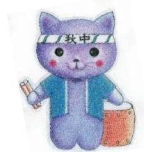
秋芳中マスコットキャラクター