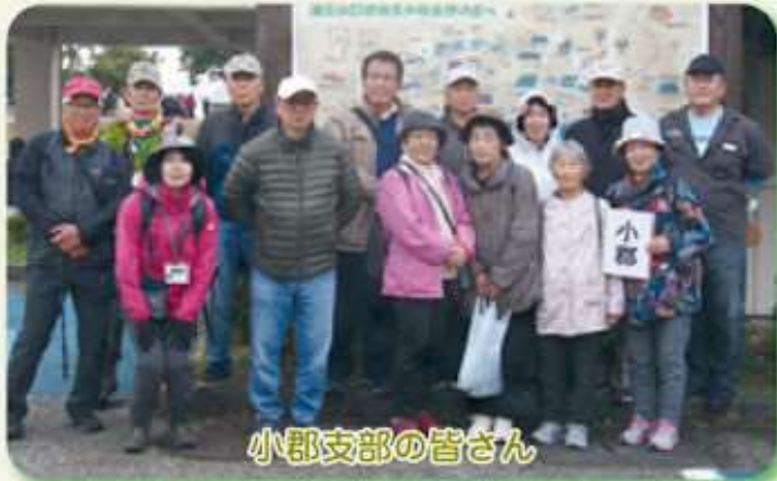
小郡支部の皆さん