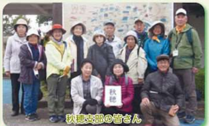
秋穂支部の皆さん