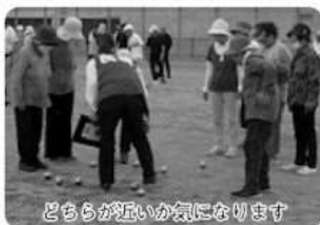
どちらが近いか気になります