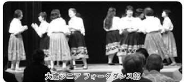
大歳シニア フォークダンス部