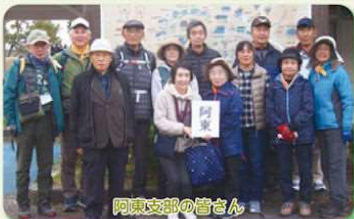
阿東支部の皆さん