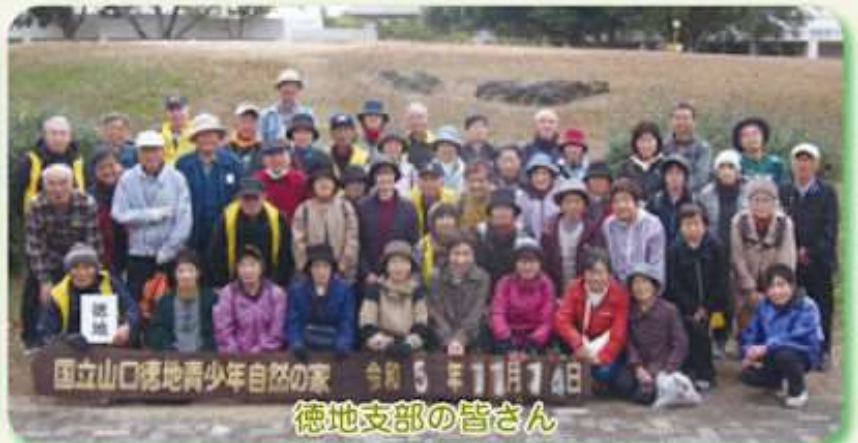
徳地支部の皆さん