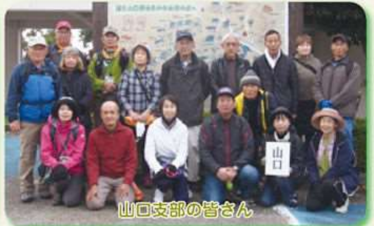
山口支部の皆さん