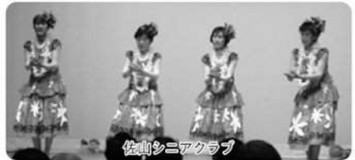
佐山シニアクラブ