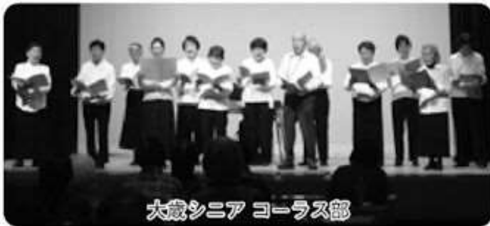
大歳シニア コーラス部