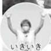
いきいきクラブ体操