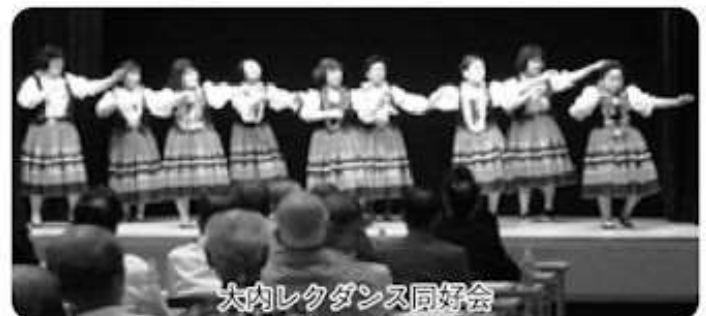
大内レクダンス同好会