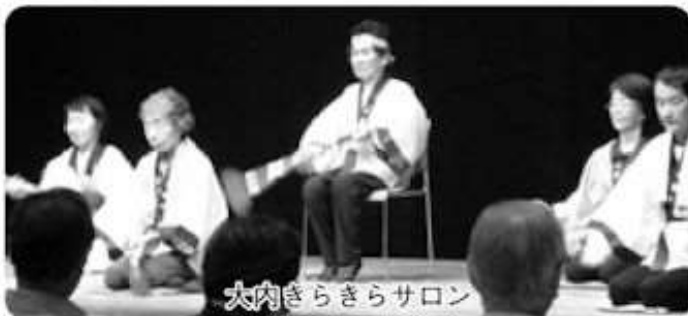
大内きらきらサロン