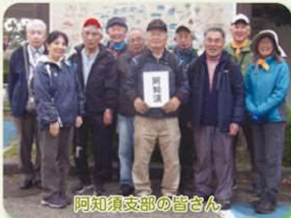
阿知須支部の皆さん