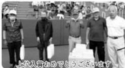
上位入賞おめでとうございます